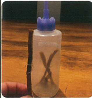
スルメを容器の中に入れます