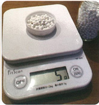
スルメの匂いがしなくなり消臭ビーズの匂いだけになるまで消臭ビーズを1gずつ入れていきます