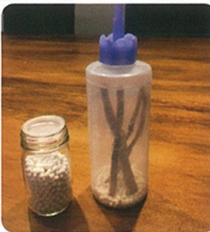
結果：10G 入れる事でスルメの強い匂いを感じなくなりました！