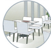
キッチン内に限らず、日常清掃用として