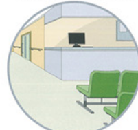
多くの人が行き交う施設内の洗浄除菌として