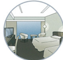
ゲストエリア、客室、バスルームなどの除菌とクリーニングを一度に