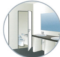
ノロウイルスの汚染源であるトイレ内での洗浄除菌として