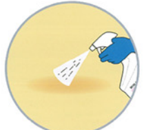
嘔吐物処理の除菌剤として