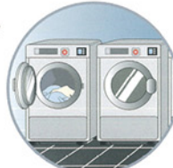
ランドリー室の二次汚染予防に